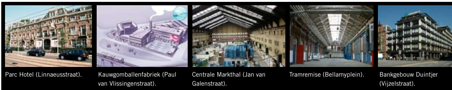
Parc Hotel (Linnaeusstraat).