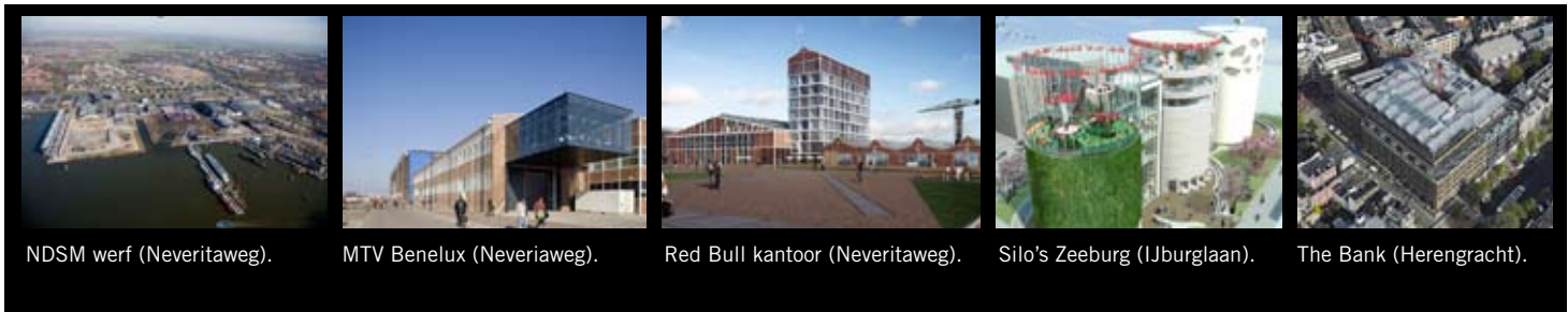
NDSM werf (Neveritaweg).